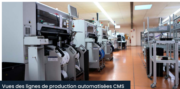
Vues des lignes de production automatisées CMS de dernière génération dédiées à la fabrication en grande série de cartes électroniques

La SNEES réalise aussi l'intégration de sous-ensembles et produits finis ainsi que du câblage filaire.