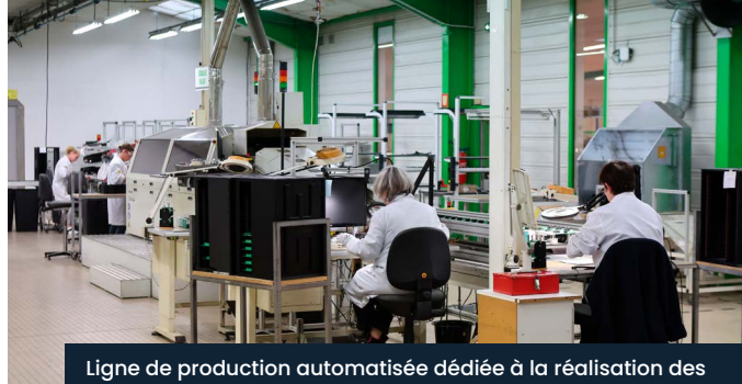
Ligne de production automatisée dédiée à la réalisation des prototypes et fabrication de cartes électroniques en petite série

“ Le Groupe WAE a souhaité accélérer son développement pour répondre aux enjeux à venir ”